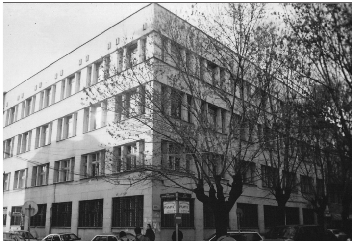
Офис на ИДЕС на ул. „Искър“ № 22, втори етаж

парт-счетоводители, изключителното право да заверяват годишните счетоводни отчети. Този процес води до окрупняването на редица индивидуални практики, особено в по-големите градове. С това се дава възможност да бъдат успешно обслужвани и по-значими клиенти, което дотогава е било приоритет на международните одиторски вериги. От своя страна бизнесът е разбрал потребността от независимия финансов одит и консултантската помощ, предоставяна му от дипломираните експерт-счетоводители. Изпълнителната власт и съдебната система също са признали техния принос за правилното протичане на процесите по промяната на собствеността и ефективното финансово управление на търговските дружества. Институтът е получил своето пълно международно признание и негови членове са делегати на различни авторитетни форуми в Европа. Така, само 10 години след възстановяване на професията, българските експерт-счетоводители имат готовност да посрещнат нарастващите световни и европейски изисквания към нея.